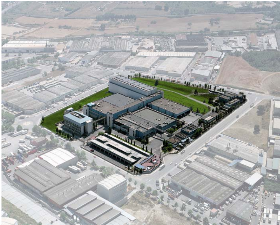
Vista aérea de la planta de KERN PHARMA en Terrassa